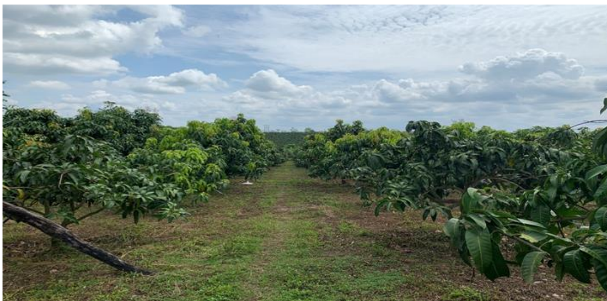
Hình minh họa: Vùng trồng Xoài xuất khẩu tại Đồng Tháp

- Diện tích các sản phẩm trồng trong nhà kính, nhà lưới hoặc các sản phẩm được liệu, các sản phẩm được trồng ở khu vực miền núi địa hình khó khăn thì theo tình hình thực tế, cụ thể ở địa phương trên cơ sở đảm bảo quy mô sản xuất hàng hóa và khả năng kiểm soát sinh vật gây hại.