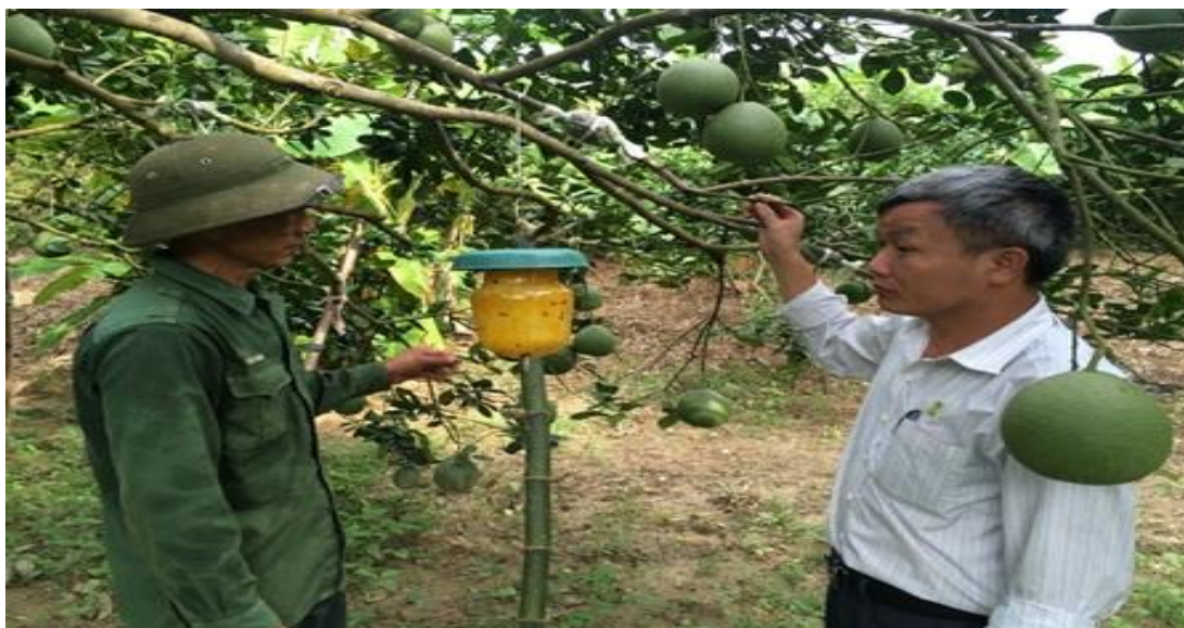
Hình minh họa: Bẫy ruồi tại vườn bưởi

- Khuyến khích áp dụng biện pháp quản lý dịch hại tổng hợp (IPM) hoặc quản lý sức khỏe cây trồng tổng hợp (IPHM).