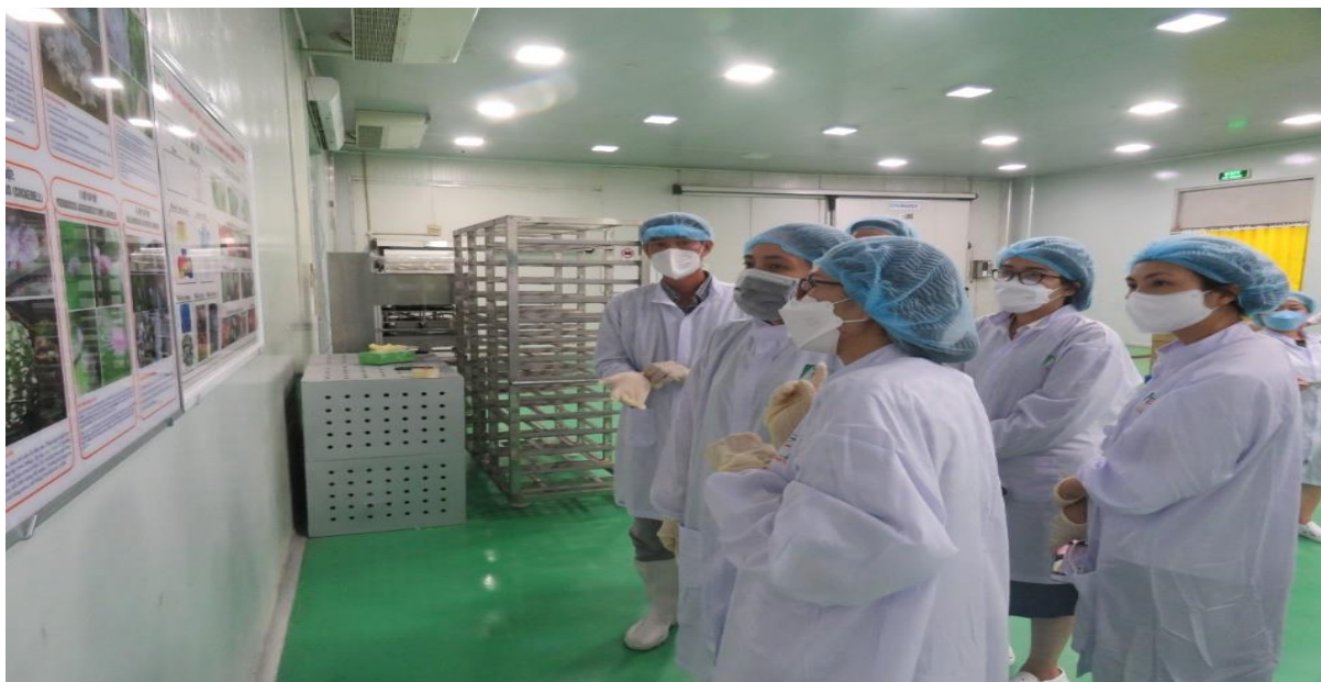
Hình minh họa: Cơ sở đóng gói

- Trang thiết bị: có đủ trang thiết bị, dụng cụ phục vụ cho việc tiếp nhận, phân loại, sơ chế, loại bỏ sinh vật gây hại, đóng gói, bảo quản theo yêu cầu của nước nhập khẩu.