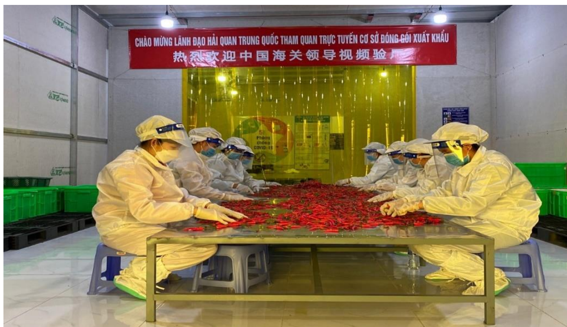
Hình minh họa: Kiểm tra trực tuyến tại cơ sở đóng gói ớt xuất khẩu đi Trung Quốc

✓ Cấp mã số và thực hiện kiểm tra trực tiếp đối với từng lô hàng hoặc gián tiếp thông qua quá trình giám sát xử lý của cơ quan kiểm dịch thực vật.