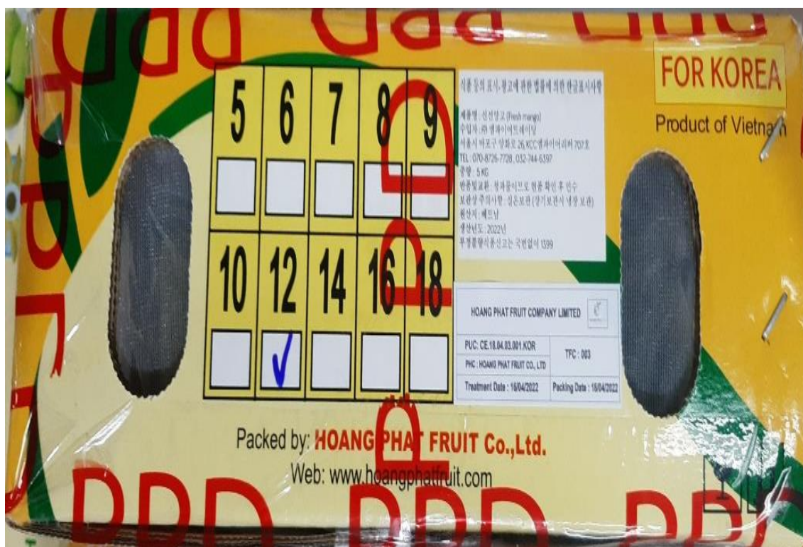
Hình minh họa: Mẫu nhãn bao bì xuất khẩu xoài đi Hàn Quốc

- Có các biện pháp để đảm bảo truy xuất nguồn gốc nguyên liệu sử dụng trong nhà đóng gói.