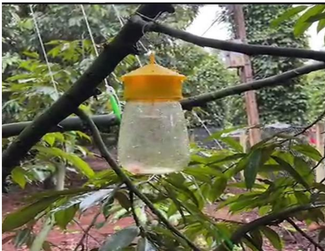
Hình minh họa: Bẫy ruồi tại vườn trồng sầu riêng

- Bố trí cán bộ kỹ thuật đã được tập huấn thực hiện kiểm tra tất cả các lô hàng trước khi xuất kho để đảm bảo hàng nông sản xuất khẩu không bị nhiễm chéo sinh vật gây hại.